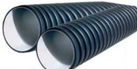
TABELLA COMPOSIZIONE CARICO TUBI IN PE CORRUGATI PER FOGNATURA NORMALIZZATI SU DN ESTERNO